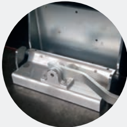
Abb. MagFly® AP (Hochleistungsmagnet)

Für die Betonfertigteilindustrie bieten wir ein großes Spektrum innovativer Lösungen zur Steigerung der Leistung und Wirtschaftlichkeit in der Produktion an. Unser innovatives Entwicklerteam arbeitet ständig an praxisgerechten Lösungen für mehr Effizienz im Betonbau.